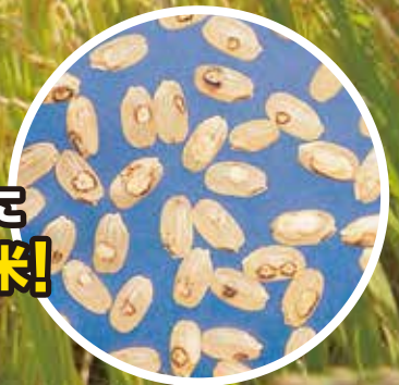
アカスジカスミカメ