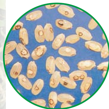
アカヒゲホソドリカスミカメ